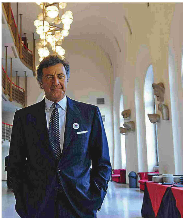
Ritaglio stampa ad uso esclusivo del destinatario, non riproducibile.