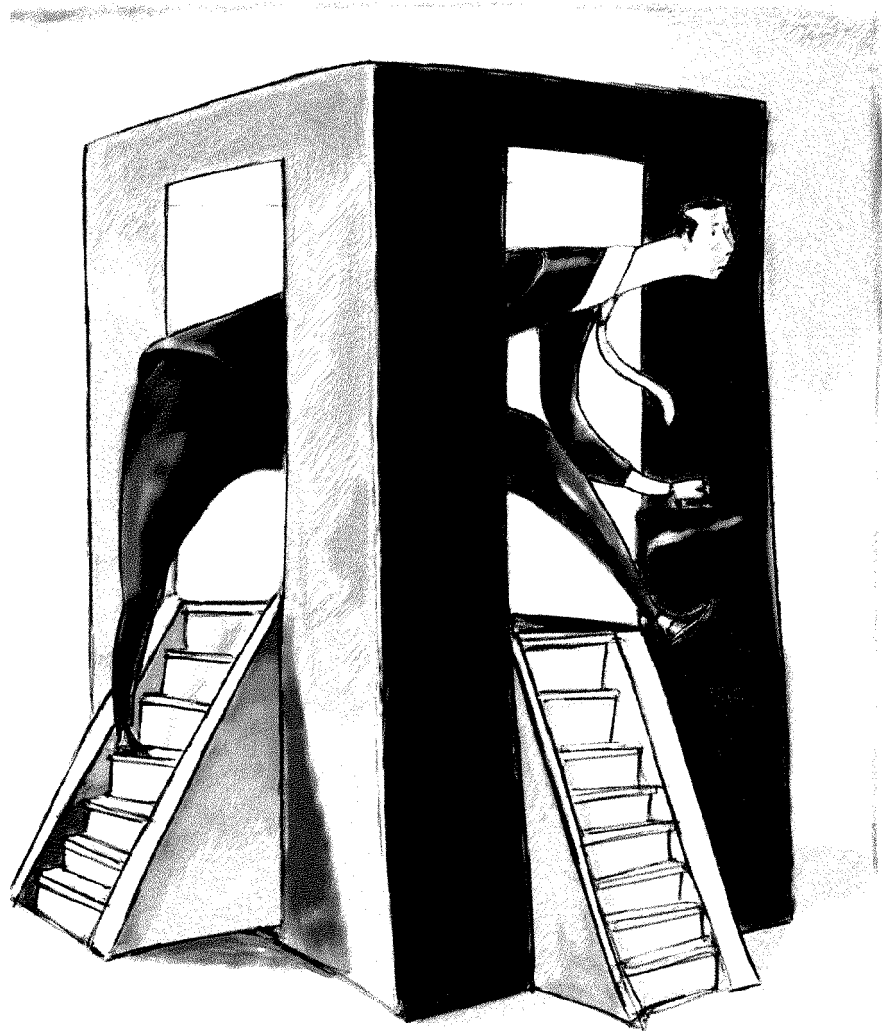
ILLUSTRAZIONE DI UMBERTO GRATI

Ma il vero discrimine con le legislazioni europee sta soprattutto nella fase delle tutele per i licenziamenti illegittimi. In Italia, se si lavora in aziende con più di 15 dipendenti, si applica l'articolo 18 in base al quale scatta quasi sempre il reintegro. Mentre le aziende devono pagare anche i mancati stipendi arretrati (la cui entità varia in base alla durata del giudizio). Un'anomalia tutta italiana. In Germania e Francia è nettamente prevalente il risarcimento danni. E in Spagna, Regno Unito e Danimarca in caso di licenziamento illegittimo è previsto (pure) un tetto massimo al ristoro dei danni.