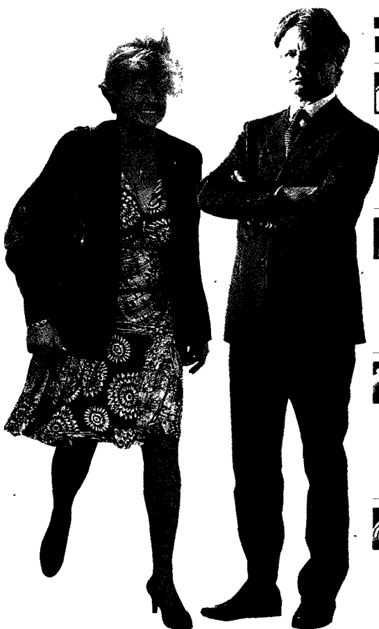
Susanna Camusso e, a destra, Giuseppe Mussari

«L'idea di Bossi di sostituire il ticket sanitario con una tassa sul tabacco è ottima»: lo sostiene Roberto Cota. Sulla stessa linea anche Luca Zaia