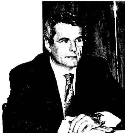
Collino: ne ha bisogno il Paese