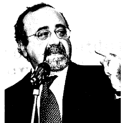
Adornato: ma col Cav non se na fa nulla