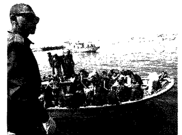
LO SBARCO Un'imbarcazione carica di migranti provenienti dalla Tunisia arrivata ieri mattina al porto di Lampedusa. L'isola, grande venti chilometri quadrati, sta ospitando tra i 4.000 e i 5.000 extracomunitari

Ritaglio stampa ad uso esclusivo del destinatario, non riproducibile.