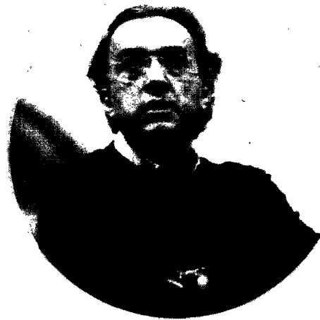
A destra, Sergio Marchionne e a lato un'immagine di Mirafiori

Rappresenta l'organizzazione della produzione dislocata in altri Stati o regioni. Il mercato globale, oltre a consentire l'acquisto di merci in luoghi diversi da quelli usuali valutando offerte a livello planetario e non più nazionale o regionale, apre la strada al trasferimento di funzioni produttive in sedi ritenute più adatte. La motivazione più frequente è quella di ridurre i costi di produzione.